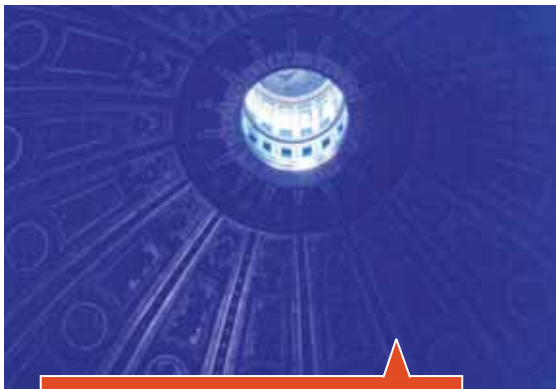
Abb. 4: Sinnbild für Zielbezogenheit und Finalismus: Kuppel des Petersdoms in Rom

In These acht stellt er die »Frage nach der Freiheit des Kindes und einem göttlichen Determinismus bzw. dem Verhältnis von Natur und Kultur des Kindes (Stichwort: Bauplan) 36 und in These neun schreibt er zum Gedanken, Kosmische Erziehung als Ethik zu interpretieren: „Dabei wird der Schöpfungsplan in Anlehnung an moderne theologische Vorstellungen als offen und nicht als festgefügtes Gefüge gesehen.“ 37