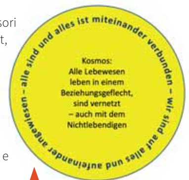
Abb. 3: Humboldts Kosmos-Begriff

Maria Montessori war überzeugt, dass es durch eine moderne, auf gute kindliche Entwicklungsprozesse orientierte Pädagogik gelingen kann, dass Kinder als spätere Erwachsene über die eigenen Potentiale verfügen können, verantwortlich handeln – mit (Selbst-) Disziplin – und so die Menschheit zu einer ‚Nazione Unica‘ weiterentwickeln. Und dass die Menschen auf einer neuen Stufe des Bewusstseins den göttlichen Plan in den Dingen und Lebewesen der Welt erkennen werden, vor allem im Kind, das sich frei entwickeln kann.