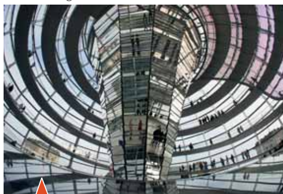
Abb. 6: Sinnbild für Vielfalt, Offenheit und Demokratie: Die Kuppel des Reichstags in Berlin

In der praktischen Arbeit der Schulen wirkt sich der finalistische Überbau Montessoris vor allem in der Kosmischen Erziehung aus, dem maßgeblichen und nach wie vor überzeugenden Konzept für die Praxis der Sechs- bis Zwölfjährigen, und zwar negativ. Es sind hier unbedingt Theoriebausteine zu integrieren, die vor allem einer Hauptforderung genügen müssen: der Widerspruchsfreiheit mit moderner natur- und geisteswissenschaftlicher Erkenntnis.