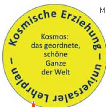
Abb. 2: Der antike Kosmos-Begriff